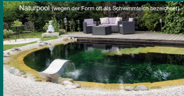
Naturpool (wegen der Form oft als Schwimmteich bezeichnet)