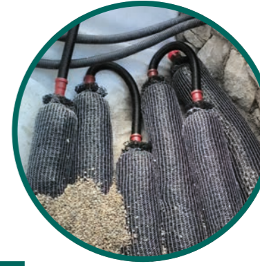
4. Hydrobalance Filter

Nach der Betonschicht wird das Becken mit Vlies ausgekleidet und danach wird die Folie verlegt. Diese ist sehr widerstandsfähig, langlebig und speziell für Naturpools gemacht.